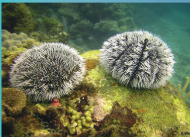
Tripeustes ventricosus - West Indian sea egg Erizo blanco