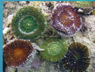
Scolymia cubensis - Artichoke coral Coral alcachofa