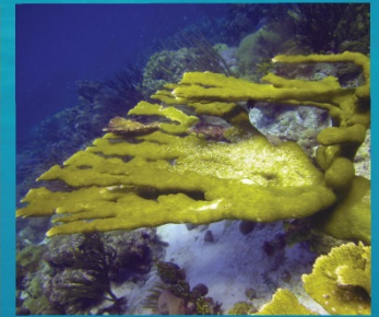
Acropora palmata - Elkhorn coral Coral cuerno de alce