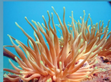
Condilactis gigantea - Giant anemone Anémona gigante