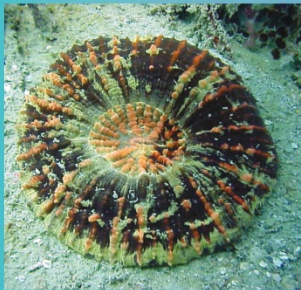
Scolymia lacera - Atlantic mushroom coral Coral hongo Atlántico