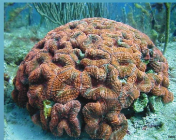
Mussa angulosa - Spiny flower coral Coral flor espinoso