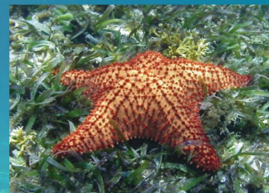
Oreaster reticulatus - Cushion sea star Estrella de mar